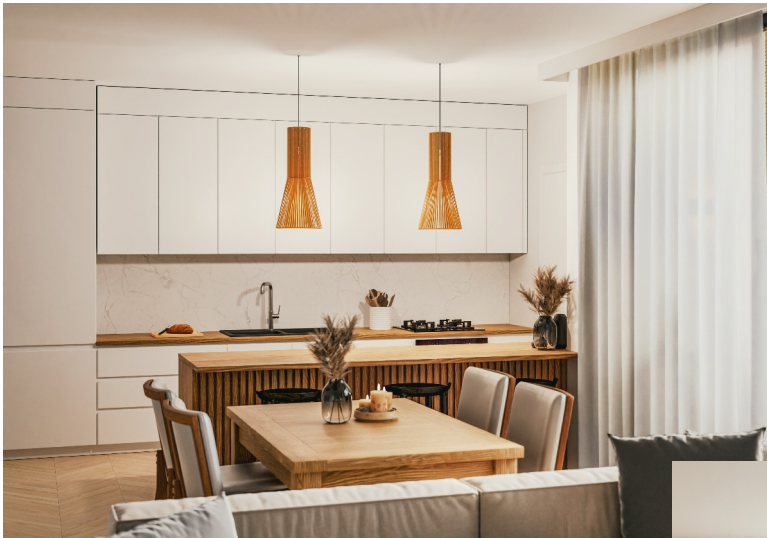
Przykład aranżacji (aranżacja nie ujęta w cenie).