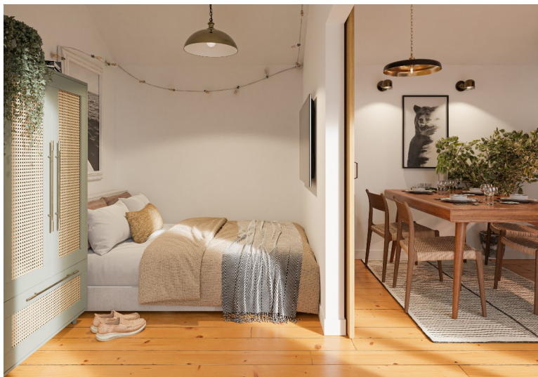
Przykład aranżacji (aranżacja nie ujęta w cenie).