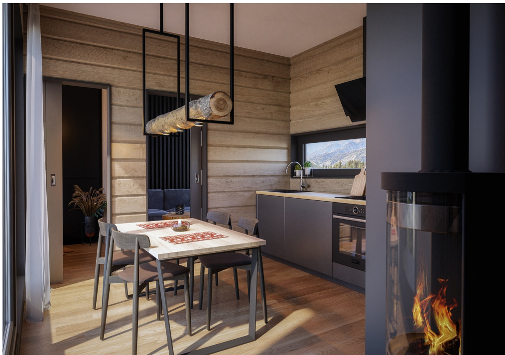
Приклад аранжування (аранжування не входить у вартість).